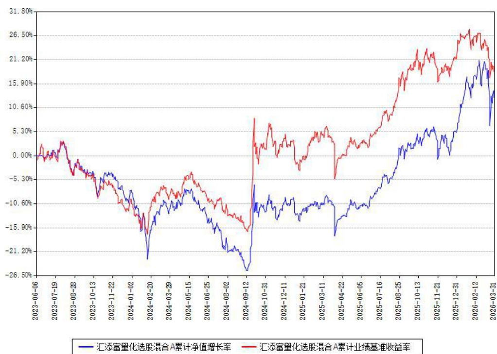
汇添富量化选股混合A累计净值增长率与同期业绩基准收益率对比图