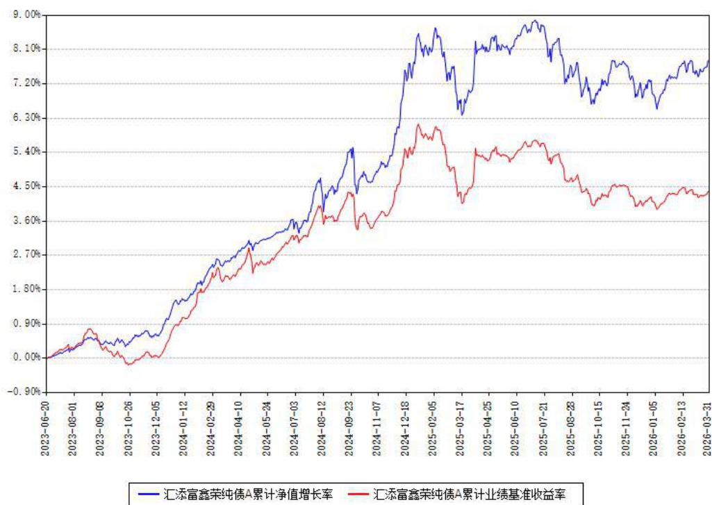
汇添富鑫荣纯债A累计净值增长率与同期业绩基准收益率对比图

(二)自基金合同生效以来基金累计净值增长率变动及其与同期业绩比较基准收益率变动的比较图