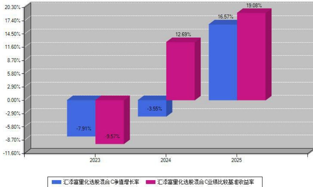
汇添富量化选股混合C每年净值增长率与同期业绩基准收益率对比图

注：数据截止日期为2025年12月31日，基金的过往业绩不代表未来表现。本《基金合同》生效之日为2023年06月06日，合同生效当年按实际存续期计算，不按整个自然年度进行折算。