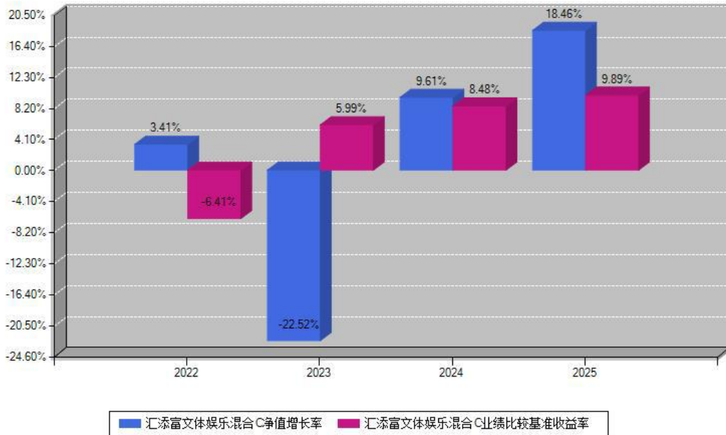
汇添富文体娱乐混合C每年净值增长率与同期业绩基准收益率对比图

注：数据截止日期为2025年12月31日，基金的过往业绩不代表未来表现。本《基金合同》生效之日为2018年06月21日，合同生效当年按实际存续期计算，不按整个自然年度进行折算。