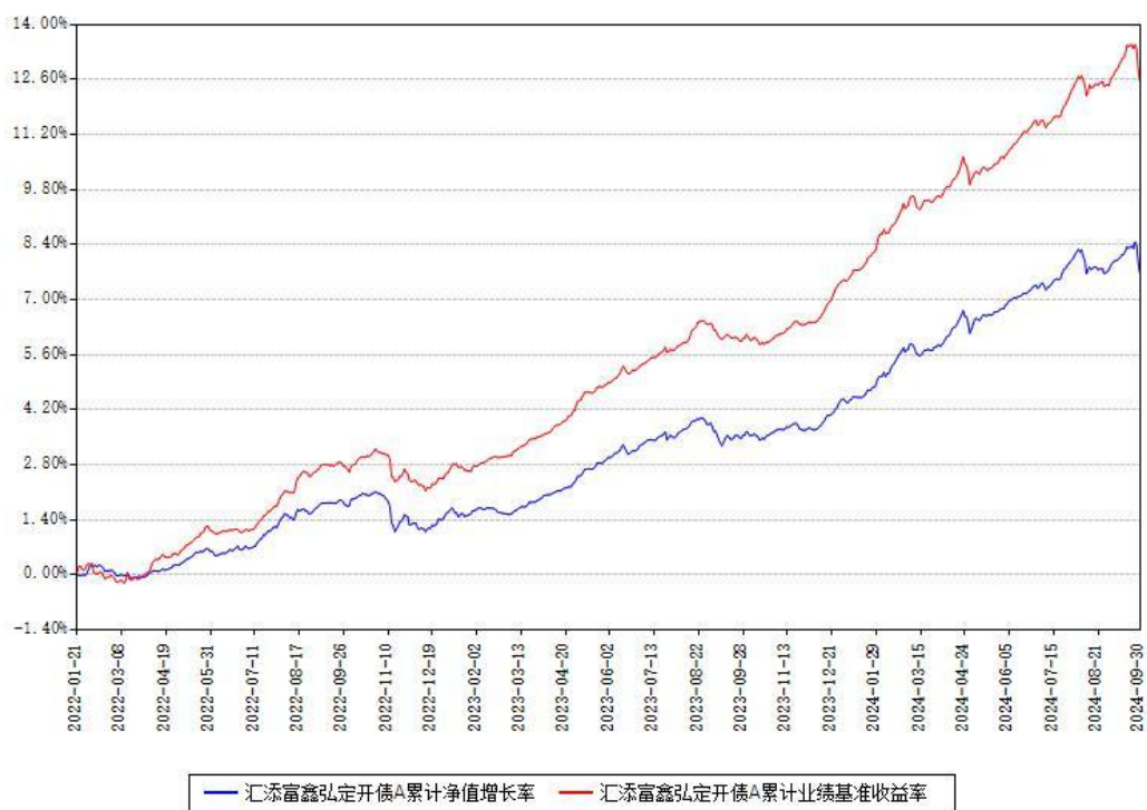
汇添富鑫弘定开债A累计净值增长率与同期业绩基准收益率对比图