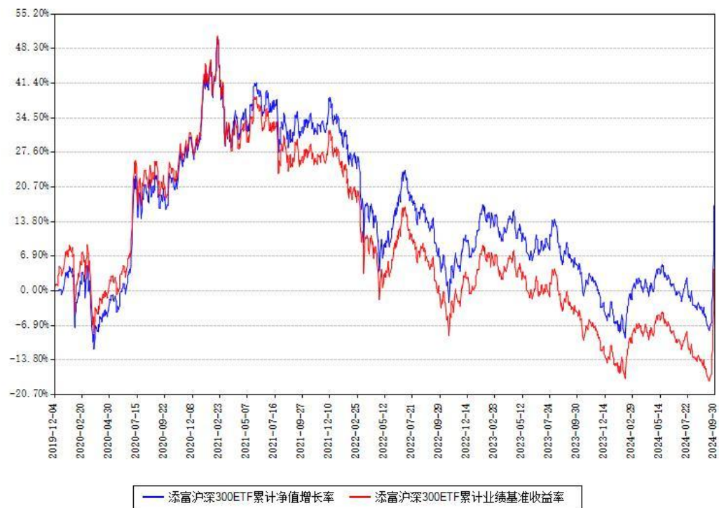
添富沪深300ETF累计净值增长率与同期业绩基准收益率对比图